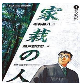
◎魚戸おさむ「家裁の人」講談社