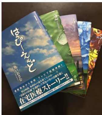
◎魚戸おさむ「はっぴーえんど」小学館