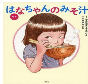
◎魚戸おさむ「絵本 はなちゃんのみそ汁」講談社