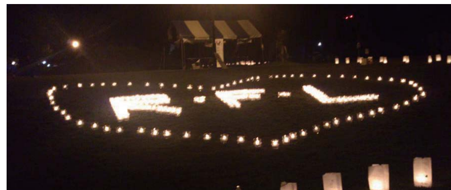
第2部キャンドルの光が幻想的なルミナリエ