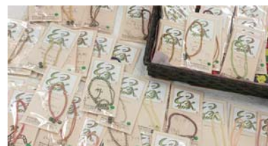
販売された復興ミサンガ