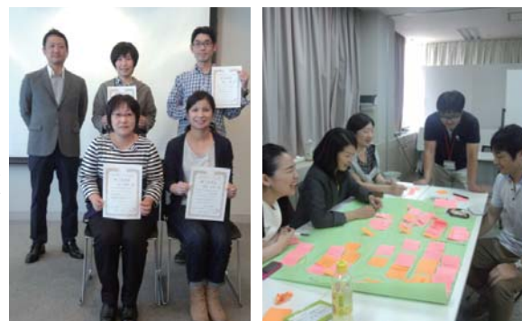
●スーパーバイザー研修修了者の方々（左）と、リーダー専門研修での一場面（右）。

9 月 6 日より始まりましたリーダー専門研修は 11 月 8 日時点で第 5 回目（全 9 回）まで終了しました。