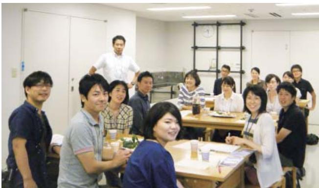
【パトリア日田 創作室】