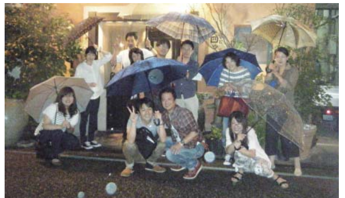
【日田市 居酒屋 四つ角前】