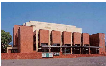
会場となった武雄市文化会館

佐賀県が故郷である私としては、佐賀県の医療福祉の動向も気になりつつ参加させていただきました。