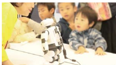
コミュニケーションロボット「パルロ」