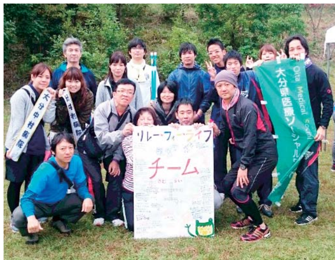
充実した表情が印象的なチーム『士』メンバー。