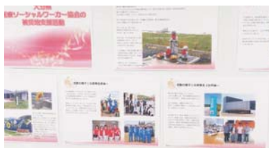
復興支援活動の様子