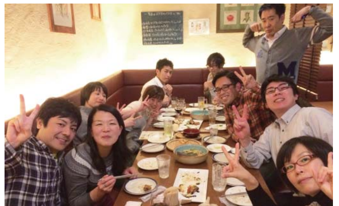
【佐伯市 ファニーズ・ベラベラ】